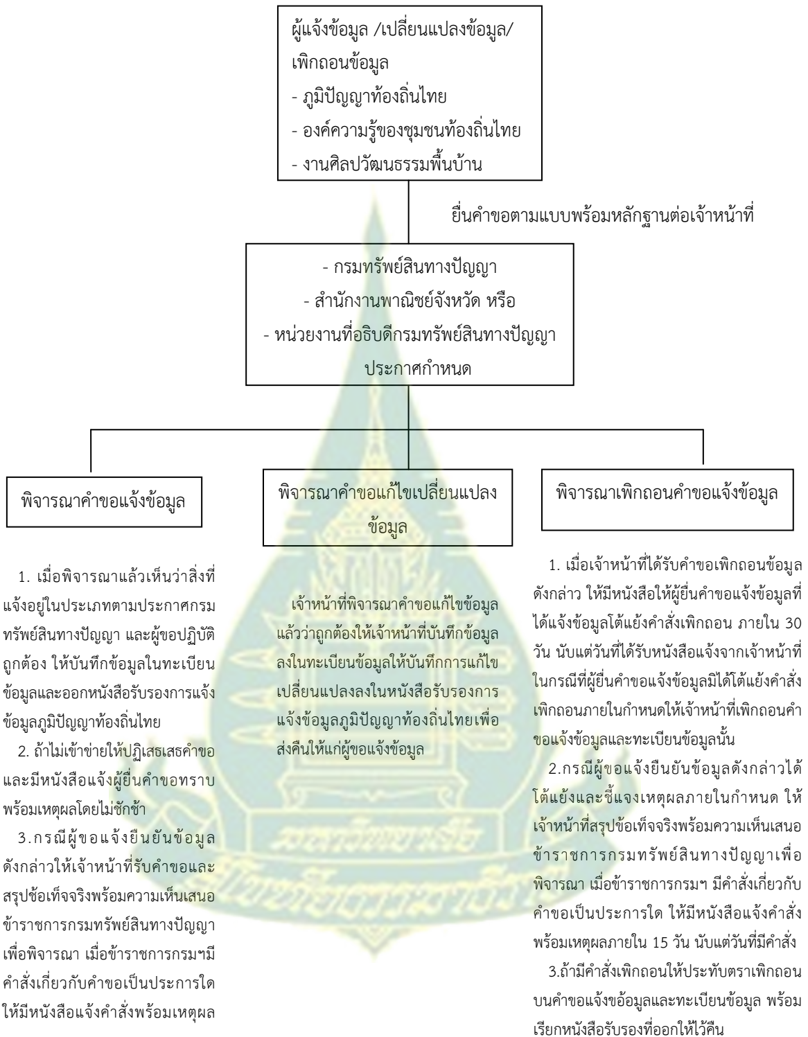
ภาพที่ 3.2 แผนผังสรุปขั้นตอนการพิจารณาคำขอ แจ้งข้อมูล / เปลี่ยนแปลงข้อมูล / เพิกถอนข้อมูล ตามระเบียบกรมทรัพย์สินทางปัญญา ว่าด้วยการแจ้งข้อมูล และขอรับบริการข้อมูลภูมิปัญญาท้องถิ่นไทย พ.ศ. 2545